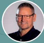
Martin Hofmann Events