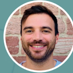
Tobias Bystrek Homepage